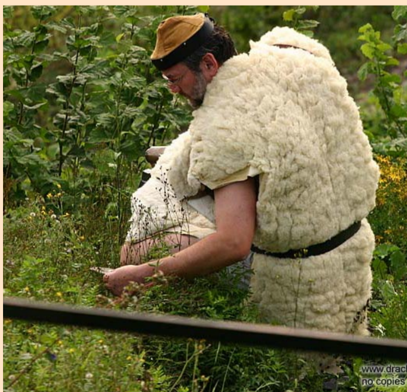
Dieser Mann wurde nicht unweit der neu entdeckten Mine gesichtet. Er behauptet ein »Zwerg« aus dem Uläath-Gebirge zu sein, was aufgrund seiner Körperhöhe (ca. 2-3 Zwerge hoch) als ziemlich unwahrscheinlich gelten darf.

SP: Magister Morgenraus, wir danken für dieses Gespräch.